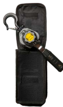
250kg - 500kg